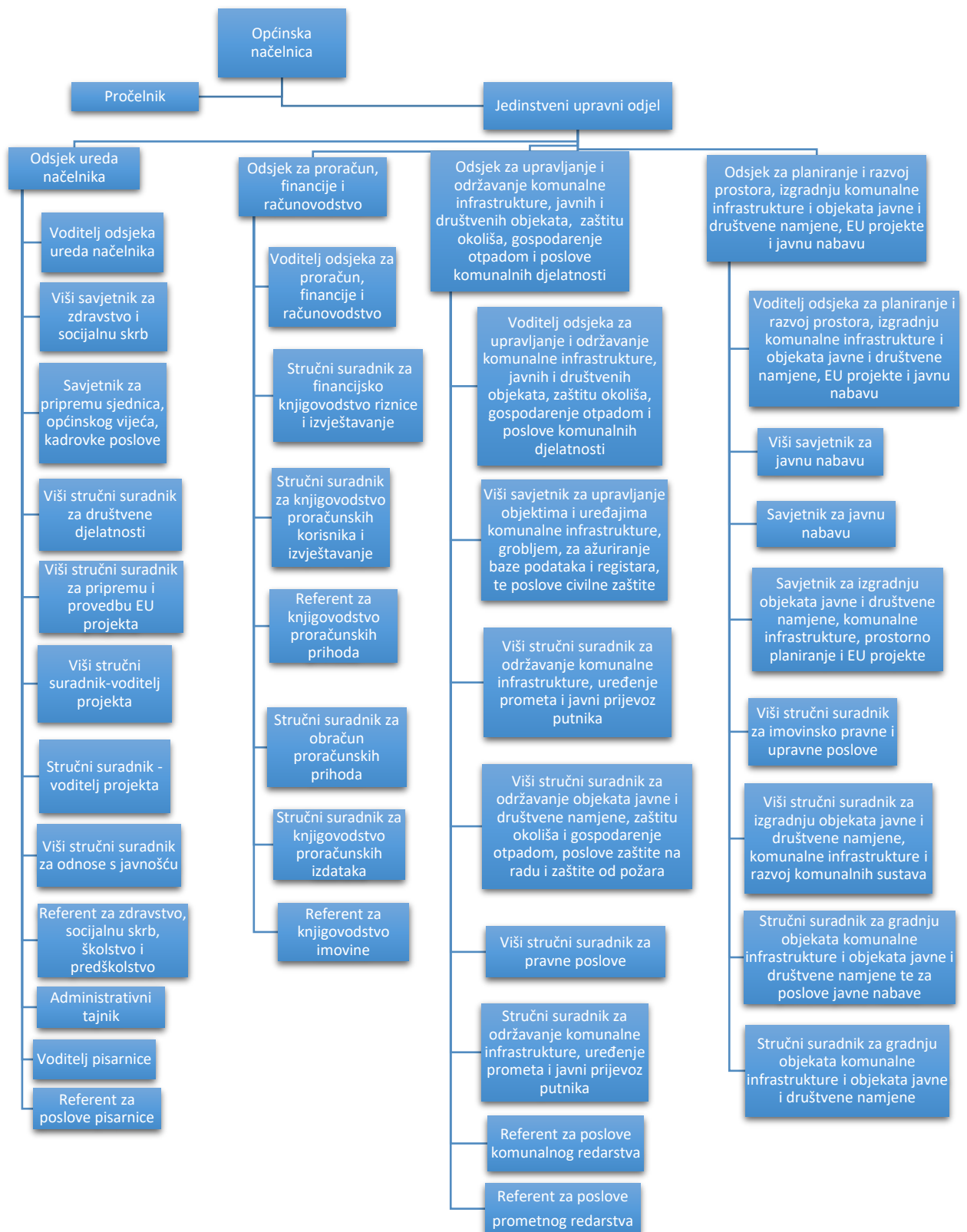
Slika 1. Organizacijska struktura Općine Viškovo