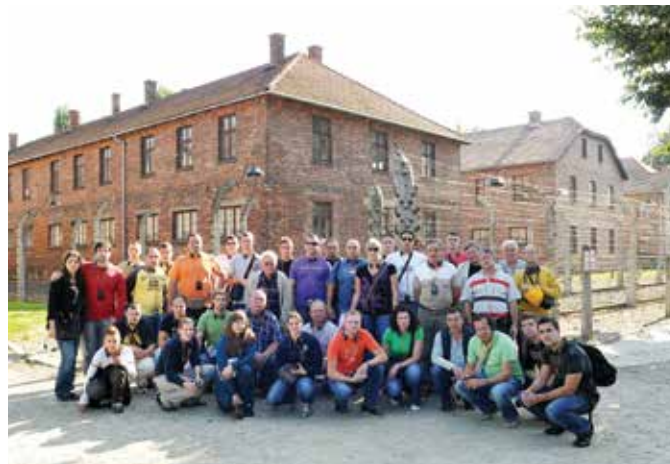
Gostovanje va Poljskoj 2009. leta