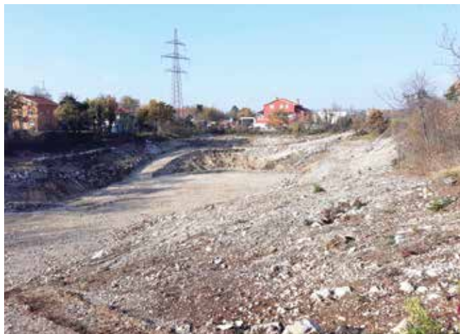
Pripremni radovi za izgradnju osnovne škole u Marinićima

Izdavanja za predškolski odgoj, rastu iz godine u godinu – za 2021. planirano je više od 18 milijuna kuna.