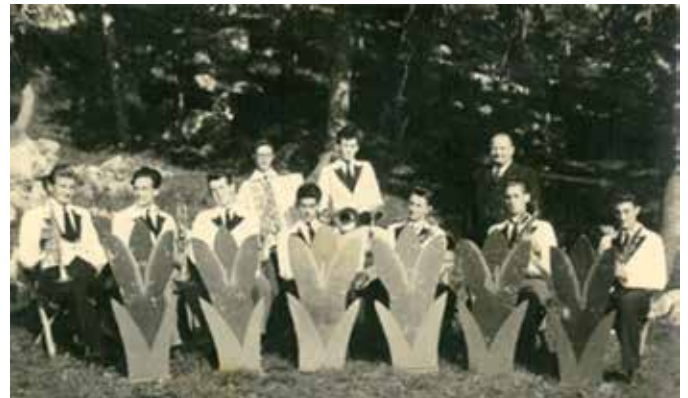
Instrumentalni sastav Melody