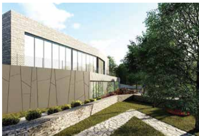
Kuća halubajškoga zvončara, jedan od ključnih strateških projekata

raciju Rijeka putem ITU mehanizma dodjeljuju EU sredstva. Jedini novi objekt koji će se graditi je Kuća halubajškoga zvončara za koju je iz Urbane aglomeracije Rijeka Viškovo dodijeljeno nešto manje od 8 milijuna kuna.