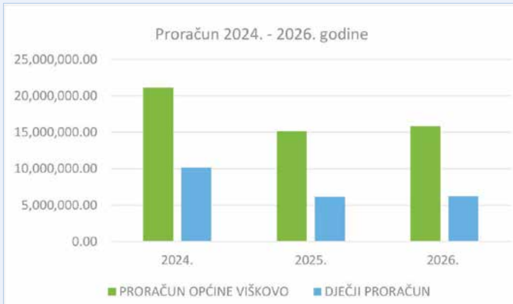
Grafikon br. 1. Dječji proračun i proračun Općine Viškovo 2024. – 2026. godine

zani uz ostvarivanje dječjih prava u Proračunu Općine za 2024. godinu čine 48% ukupnog proračuna dok je kroz projekcije proračuna za 2025. i 2026. godinu planirano izdvajanje na razini 40% proračuna Općine. Navedeni podatak pokazuje iznimnu osjetljivost Općine Viškove na potrebe dječje populacije i visoku razinu zadovoljavanja njihovih potreba u svim segmen-