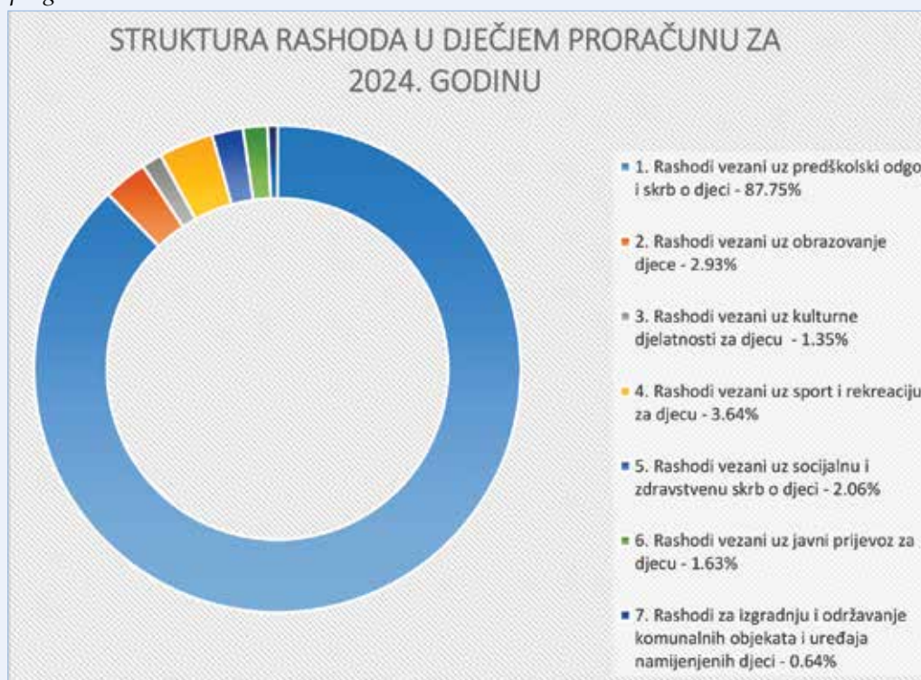
Grafikon br. 2. Struktura planiranih proračunskih rashoda u Dječjem proračunu prema programima

U okviru ovog programa osigurana su sredstva za subvencije produženog boravka i nabavu radnih bilježnica učenicima osnovnih škola, za nagrađivanje odličnih učenika u osnovnim školama u svrhu poticanja njihove izvrsnosti, sufinanciranje dodatnih osnovnoškolskih programa iznad propisanog standarda te za