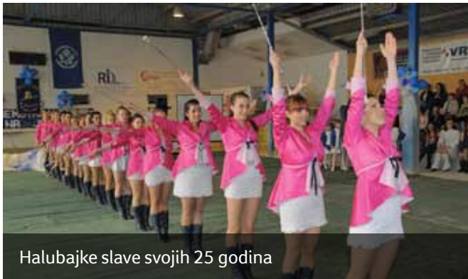
Halubajke slave svojih 25 godina