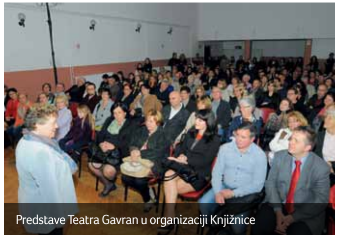
Predstave Teatra Gavran u organizaciji Knjižnice