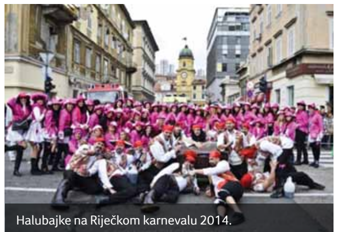
Halubajke na Riječkom karnevalu 2014.