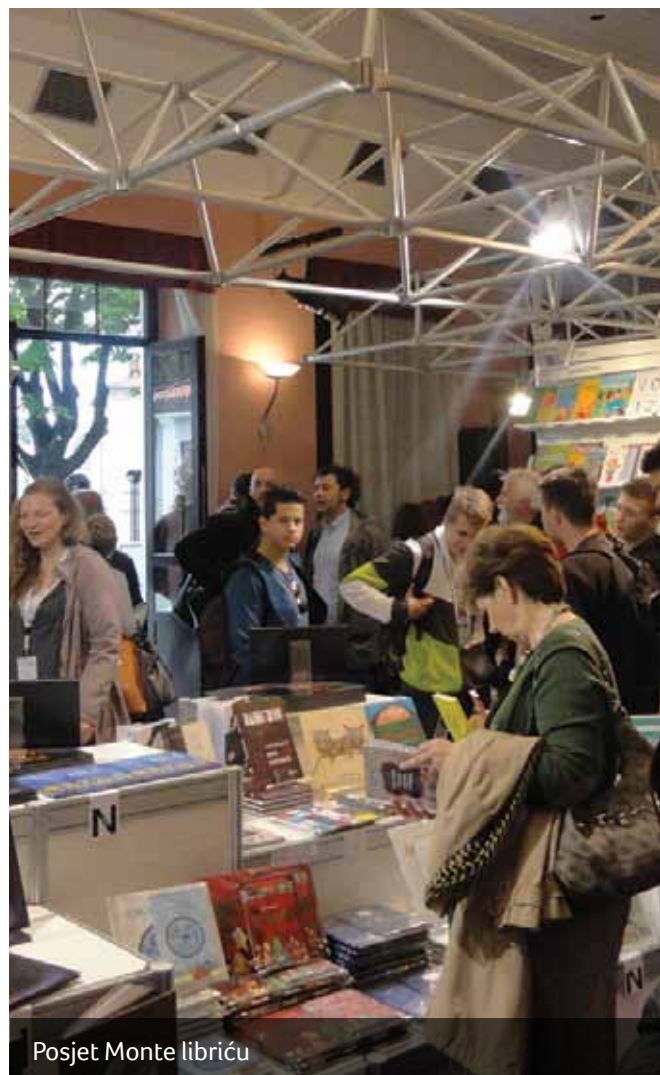
Posjet Monte libriću