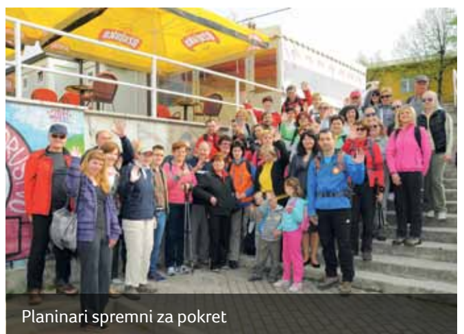
Planinari spremni za pokret