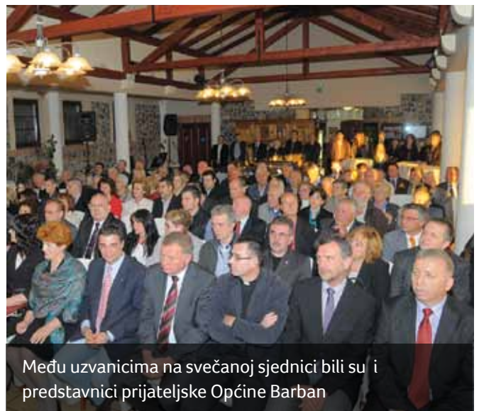
Među uzvanicima na svečanoj sjednici bili su i predstavnici prijateljske Općine Barban