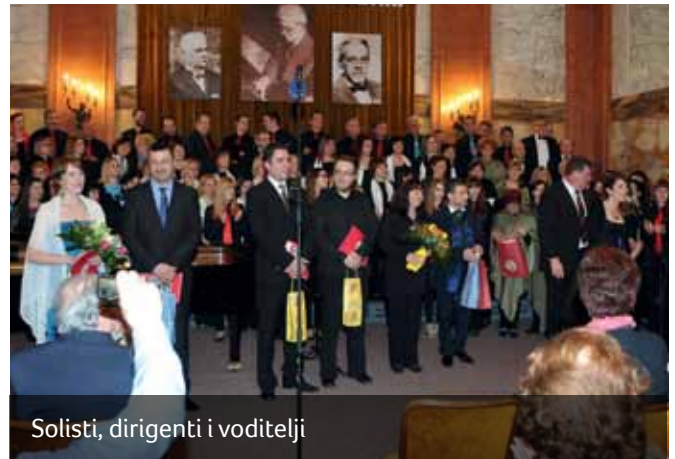
Solisti, dirigenti i voditelji