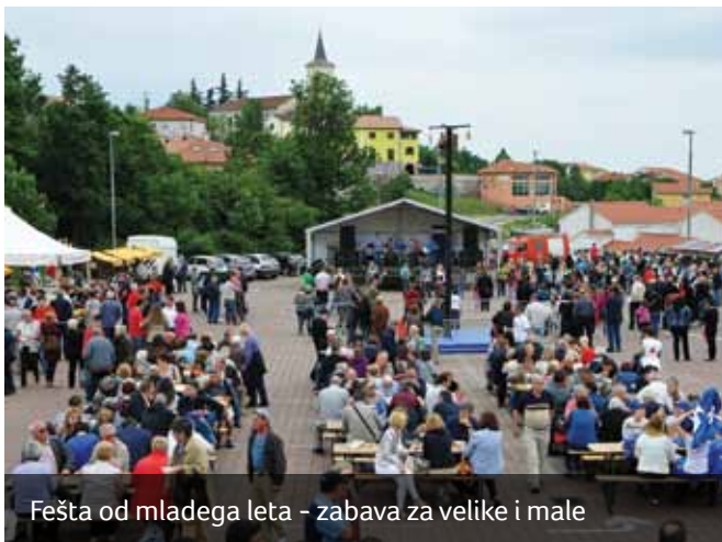
Fešta od mladega leta - zabava za velike i male

U glazbenom dijelu programa nastupili su Marinićeva muzike, Yamasica i Pampa Benda.