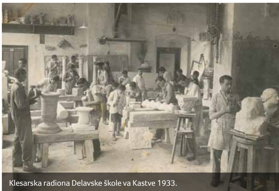
Klesarska radiona Delavske škole va Kastve 1933.