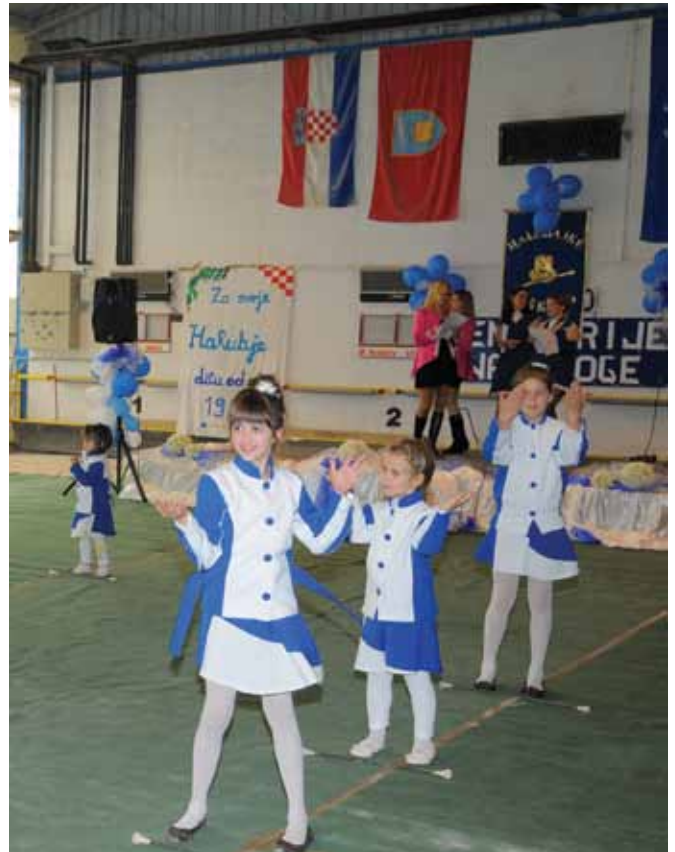
Male Halubajke na 25. obljetnici

Dvadeset pet godina dugo je razdoblje. Da bi se nešto postiglo, treba uložiti puno rada, vjere i ljubavi u zajedništvo. Posebno i veliko hvala Općini Viškovo, koja svih dvadeset pet godina prati rad Udruge. Također, hvala roditeljima i prijateljima koji su pomagali da udruga naraste i slavi dvadeset i peti rođendan. Hvala na dobroj i plodonosnoj suradnji i Prvim riječkim mažoretkinjama, Umaškim, Labinskim, Opatijskim, Rovinjskim, Halubajskim mažoretkinjama i mažoretkinjama Pisarovine. Veliko hvala i svima ostalima koji su na bilo koji način podržali „Halubajke“ Viškovo tijekom ovih dvadeset pet godina postojanja.