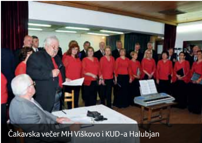
Čakavska večer MH Viškovo i KUD-a Halubjan