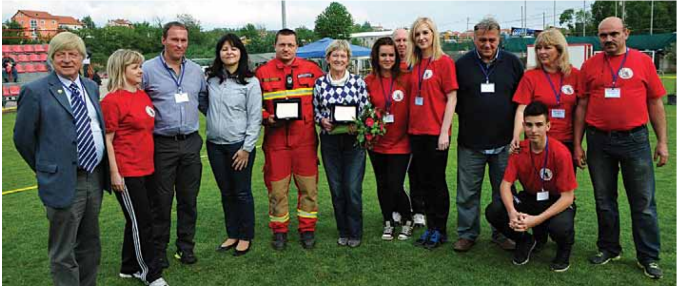
Ponosni pobjednici izložbe u društvu organizatora i sudaca

3. SPECIJALNA IZLOŽBA NJEMAČKIH OVČARA ODRŽANA 26. TRAVNJA 2014. NA NOGOMETNIM TERENIMA NK HALUBJAN PRIVUKLA IZLAGAČE IZ HRVATSKE I SUSJEDNIH ZEMALJA. UDRUZI UZGAJIVAČA NJEMAČKIH OVČARA "HALUBJE 2011" IZ VIŠKOVA DODIJELJENA ČAST ORGANIZACIJE GLAVNE UZGOJNE IZLOŽBE NJEMAČKIH OVČARA – DRŽAVNOG PRVENSTVA HRVATSKE 5. LISTOPADA 2014.