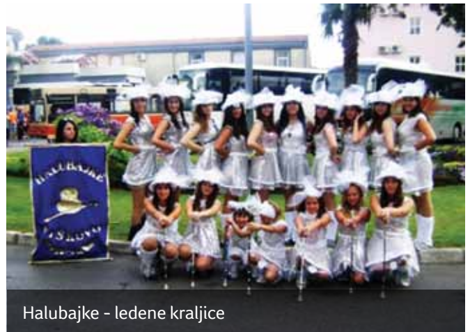
Halubajke - ledene kraljice