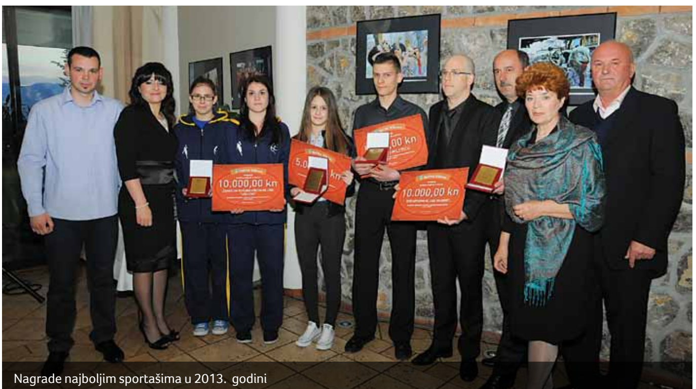
Nagrade najboljim sportašima u 2013. godini