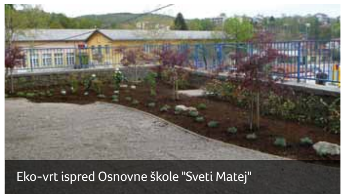
Eko-vrt ispred Osnovne škole "Sveti Matej"

Udruga Krizni Eko Stožer Marišćina zahvaljuje svim volonte-