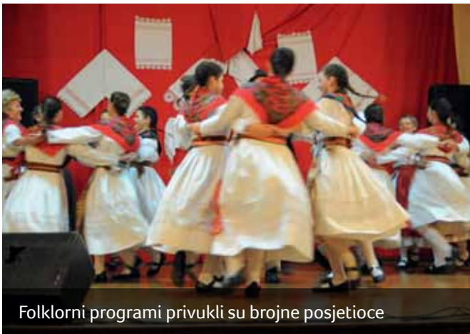
Folklorni programi privukli su brojne posjetioce