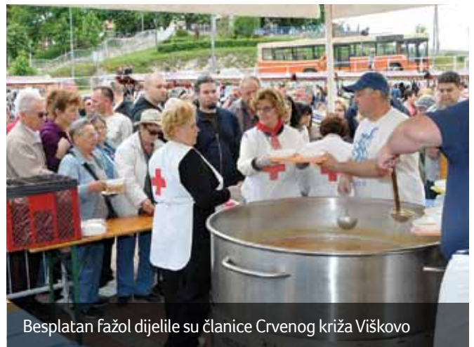
Besplatan fažol dijelile su članice Crvenog križa Viškovo