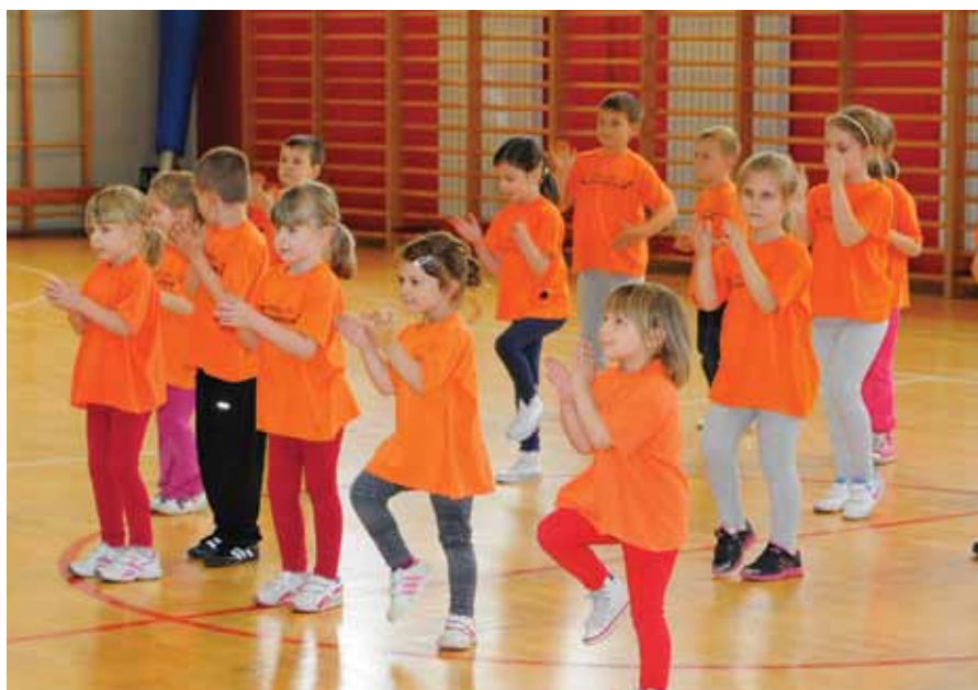
Uvijek zanimljive sportske igre Dječjeg vrtića "Zvončica"