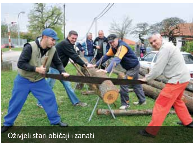
Oživjeli stari običaji i zanati