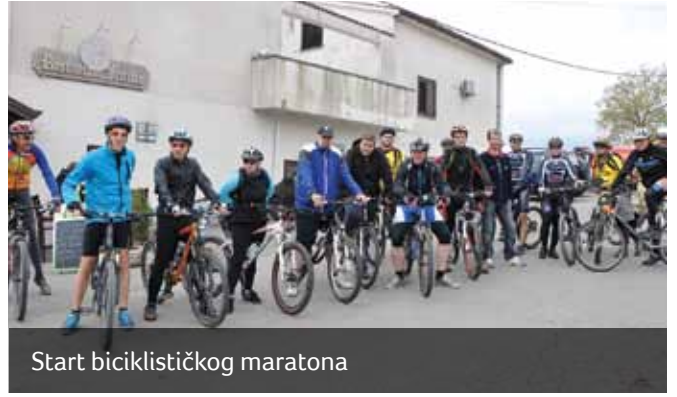
Start biciklističkog maratona