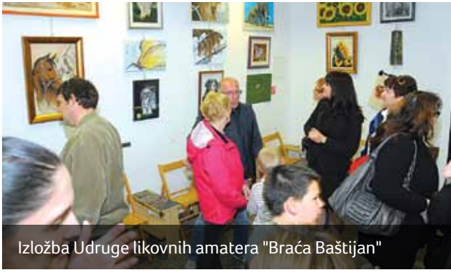
Izložba Udruge likovnih amatera "Braća Baštijan"