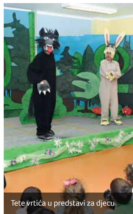
Tete vrtića u predstavi za djecu

tako Viškovo brojnim gradovima svijeta koji obilježavaju Dan sreće.