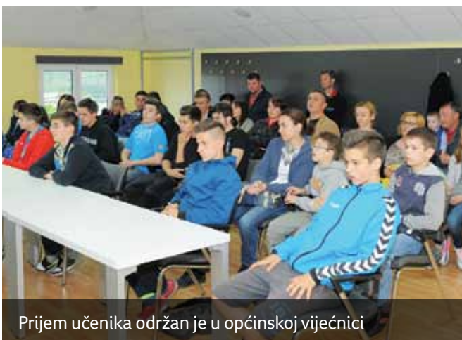
Prijem učenika održan je u općinskoj vijećnici