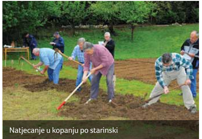
Natjecanje u kopađu po starinski