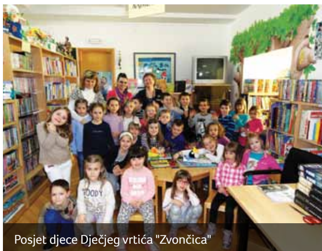
Posjet djece Dječjeg vrtića "Zvončica"