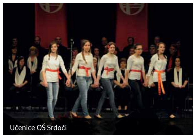
Učenice OŠ Srdoči