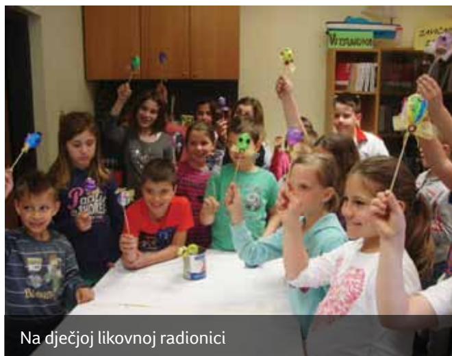
Na dječjoj likovnoj radionici

Vesela skupina vrtićara iz DV „Zvončica” posjetila je 12. ožujka sa svojim tetama našu Knjižnicu da bi se upoznala sa zanimanjem knjižničar. Knjižničarke Ivana i Branka ispričale su im ukratko put knjige, od nabave, preko obrade i na kraju do krajnjeg korisnika, člana Knjižnice koji knjigu posuđuje. Ivana ih je provela po svim odjelima koje ima Knjižnica, a najzanimljiviji im je bio knjigomat – uređaj preko kojeg se knjiga može vratiti u bilo koje doba dana. Nadamo se da će većina djece postati naši budući članovi i uživati u svim aktivnostima što se provode u Knjižnici.