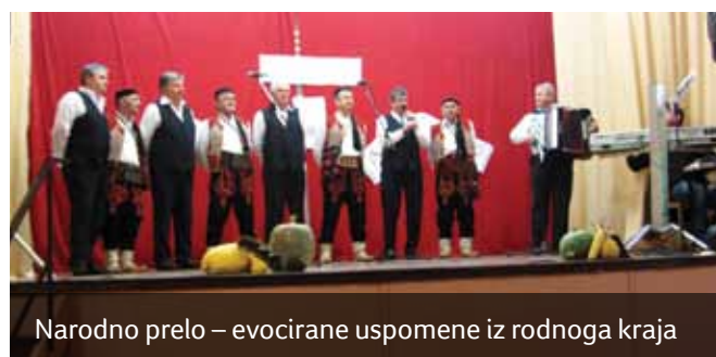
Narodno prelo – evocirane uspomene iz rodnoga kraja