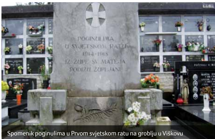
Spomenik poginulima u Prvom svjetskom ratu na groblju u Viškovu

pukovnije i ratnu mornaricu. Istrani i Kastavci, koji su u ono vrijeme zemljopisno spadali pod Istru, bili su uglavnom regrutirani u 5. i 87. K.u.K. domobransku pukovniciju. Uz Dalmatince i Istrane, Kastavci su u znatnom broju bili i pripadnici ratne mornarice (K.u.K. Kriegsmarine) Uoči rata Austro-Ugarska je mobilizirala ukupno 3.25 milijuna vojnika i to sve sposobne muškarce rođene između 1872. i 1893. godine. Hrvati su uglavnom bili upućivani na istočni front u Galiciju i Karpate, a kasnije i na talijanski front. Raniji masovni odlazak kastavskih mladića u Ameriku osjetio se u porodicama kao nedostatak radne snage u obradi zemlje, a naročito je to došlo do izražaja kada su preostali sposobni muškarci mobilizirani i poslani na bojište. Tako je sav teži posao u mnogim porodicama ostao na ženama i starcima. Ubrzo je nakon početka rata, ekonomska situacija u cijeloj Monarhiji pa tako i u Hrvatskoj postala vrlo teška. O tome svjedoči činjenica da je vladala nestašica hrane, a kruh se dobivao na bonove. Stanovništvo na selu pa tako i u Kastavštini donekle je bio u povoljnijem položaju od gradskog stanovništva, jer se obradom zemlje manje ovisilo o snabdijevanju hranom. Kako je rat