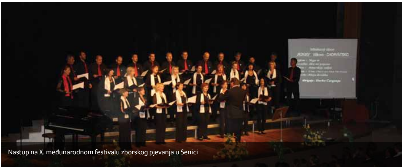
Nastup na X. međunarodnom festivalu zborskog pjevanja u Senici