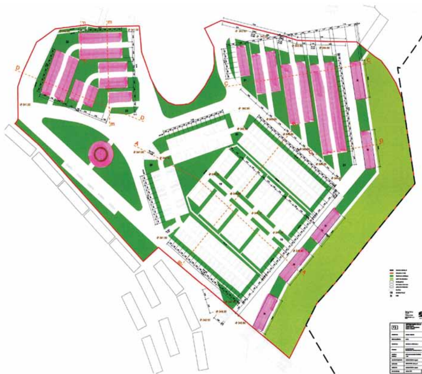
Shematski prikaz III. faze proširenja groblja