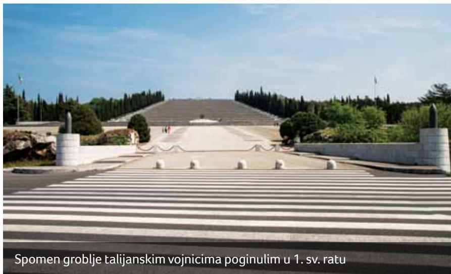
Spomen groblje talijanskim vojnicima poginulim u 1. sv. ratu

četkom 1918. godine koja je okrutno ugušena. Od 386 uhapšenih mornara 48% bilo je Hrvata i Slovenaca, 20% Talijana, 13% Čeha i Slovaka, a svega 10% Nijemaca i 8% Mađara. Dezerterstvo je uzimalo sve više maha. Zeleni kadar naziv je za hrvatske domobrane dezertere, koji su tijekom rata pobjegli iz austro-ugarskih postrojbi u „zelena šumska prostranstva“ Slavonije i Hrvatskog zagorja. Ta je pojava uvjetovana teškim gubicima na frontama, nikakvom motivacijom za daljnje ratovanje, nestašicama i ratnom bogaćenju. Dezerterske skupine postojale su sve veće a svoj odušak našli su u pljački i otimanju po gradovima i vlastelinstvima. Rat je konačno završio u studenom 1918. godine. Mnogi su zauvijek ostali na frontama Karpata, Galicije ili Italije, ili su bili zarobljeni u Rusiji, pa tako danas u ukrajinskoj Galiciji postoji više groblja bezimernih hrvatskih domobrana. Završetkom rata kolone izmučenih domobrana vraćale su se kući.