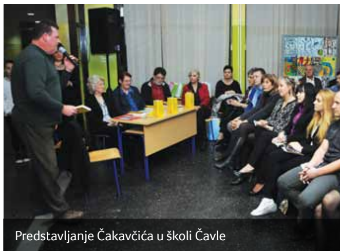
Predstavljanje Čakavčića u školi Čavle