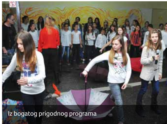
Iz bogatog prigodnog programa