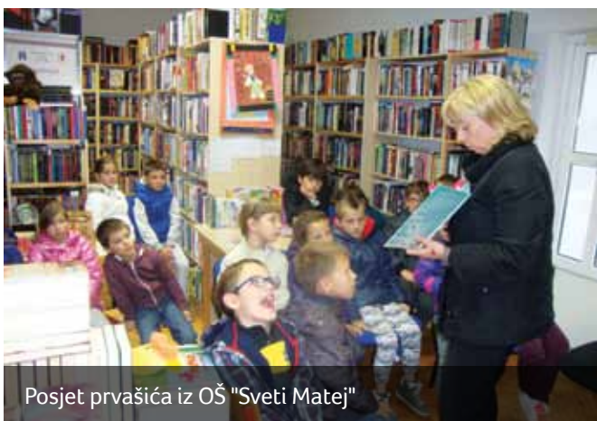
Posjet prvašića iz OŠ "Sveti Matej"