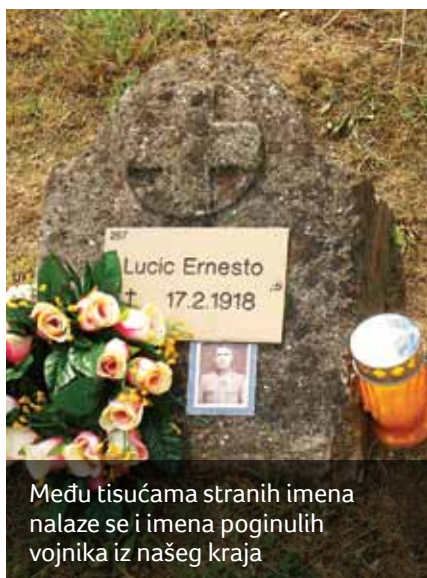
Među tisućama stranih imena nalaze se i imena poginulih vojnika iz našeg kraja

Nezadovoljstvo zbog besmislenog rata bilo je sve veće u redovima vojske pa su izbijale pobune. Jedna od najvećih je pobuna mornara u Boki Kotorskoj po-