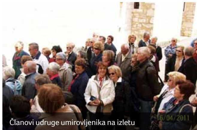
Članovi udruge umirovljenika na izletu

Tijekom godine organizirani su i brojni izleti za koje uvijek postoji veliko zanimanje članstva. Treba naročito istaknuti sportsku aktivnost naših članova. Uspostavljena je i vrlo dobra suradnja s Udrugama umirovljenika iz Opatije, Matulji, Kastva i