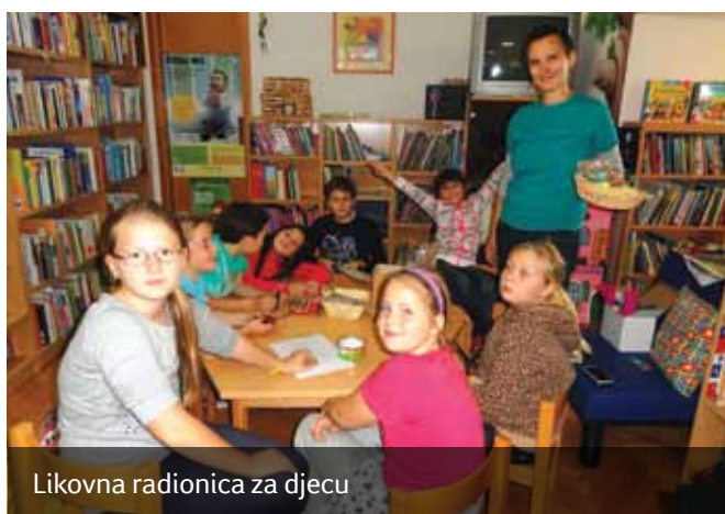
Likovna radionica za djecu