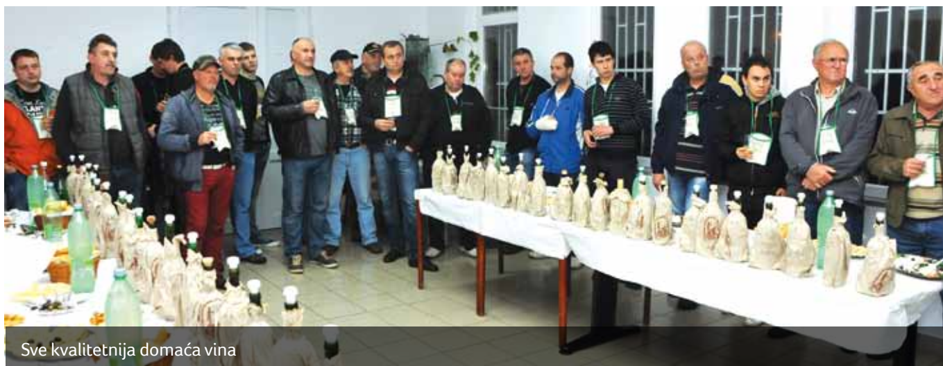
Sve kvalitetnija domaća vina