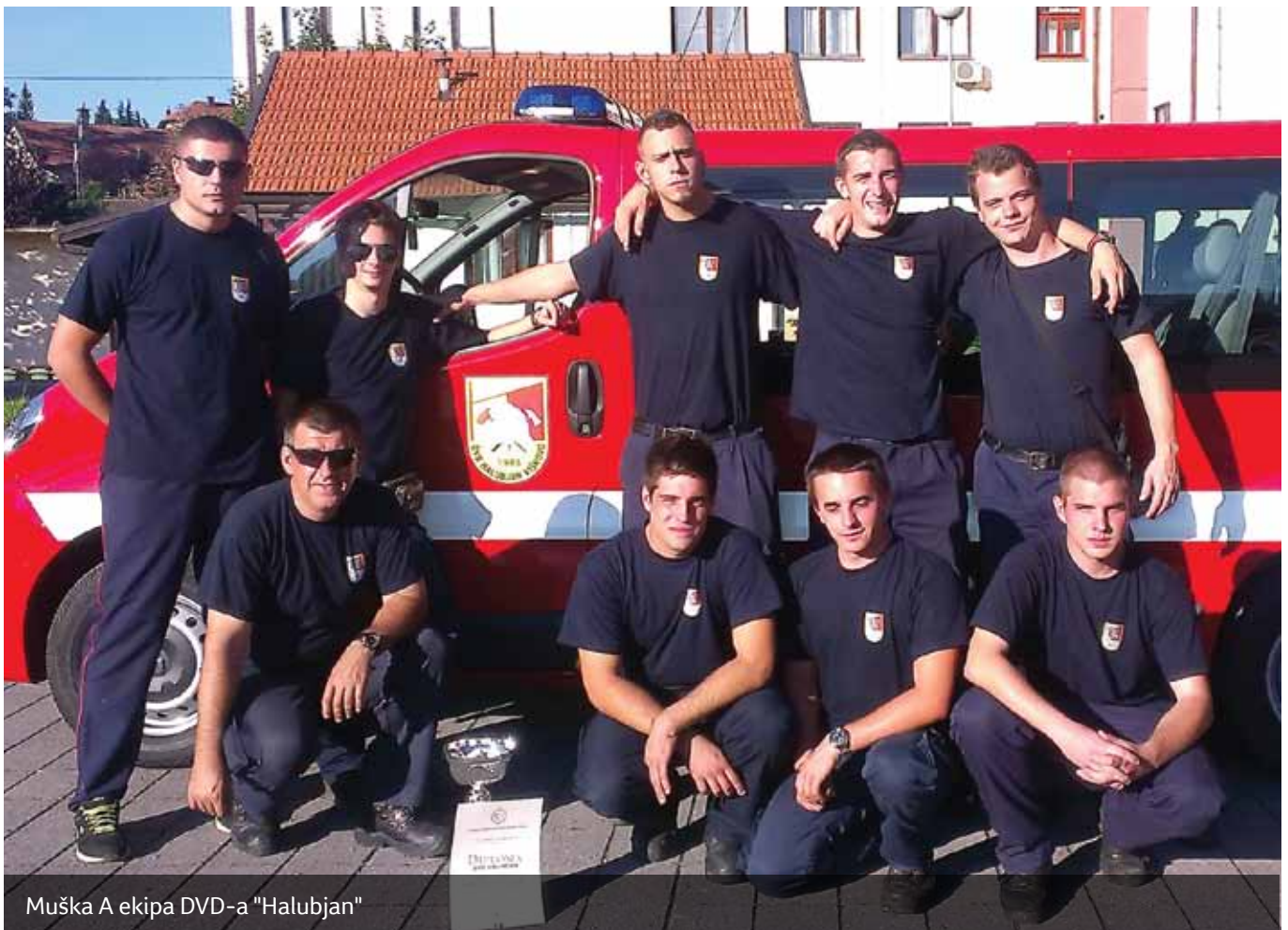
Muška A ekipa DVD-a "Halubjan"