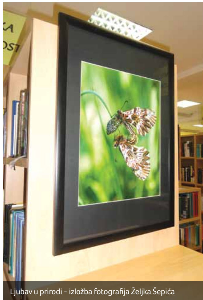
Ljubav u prirodi - izložba fotografija Željka Šepića