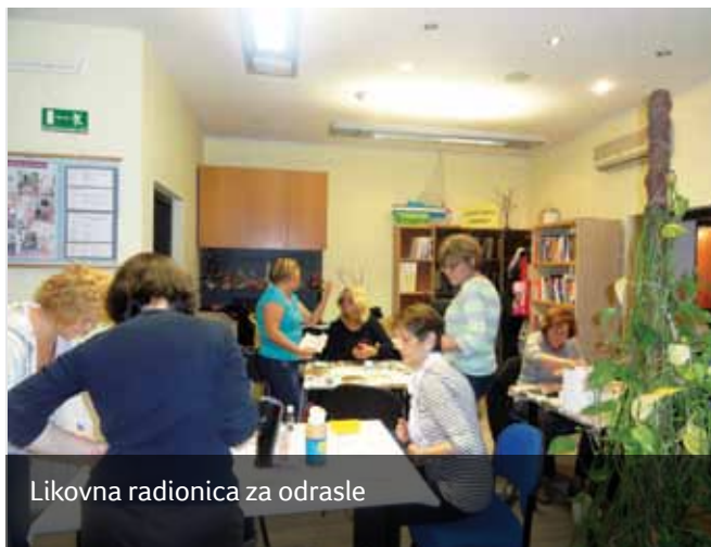
Likovna radionica za odrasle