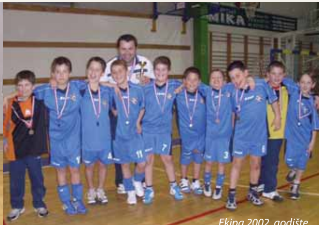
Ekipa 2002. godište