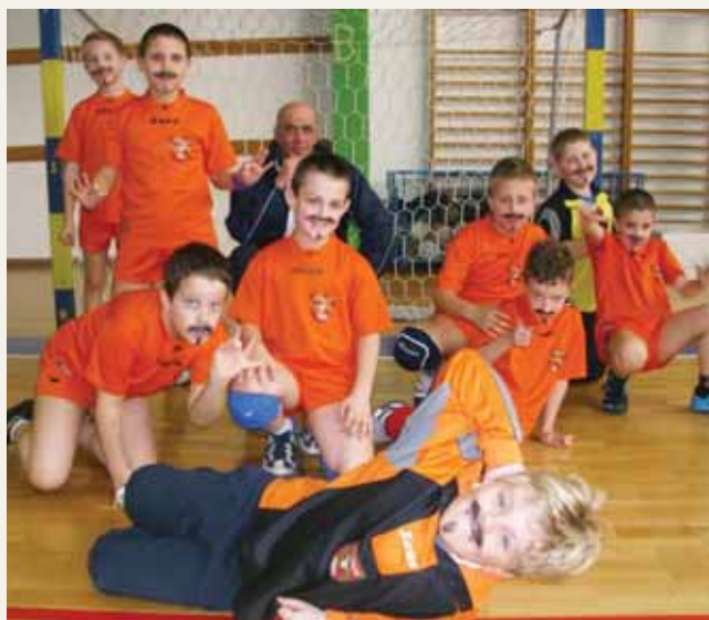
Ekipa 2003. godišta

Na 9. Međunarodnom turniru u Kastvu, održanom 18. 02. 2012. RK Halub je nastupio sa četiri ekipe.