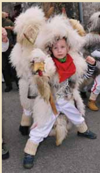
8. smotra Mićih zvončara - najuspješnija do sada