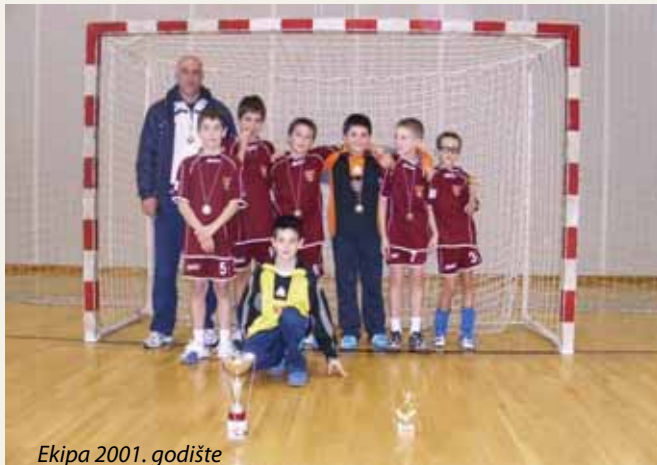
Ekipa 2001. godište