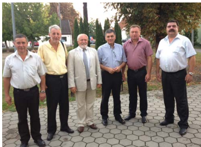
Predstavnici Općine Viškovo sa domaćinima

DELEGACIJA OPĆINE VIŠKOVO U POSJETI ERNESTINOVU