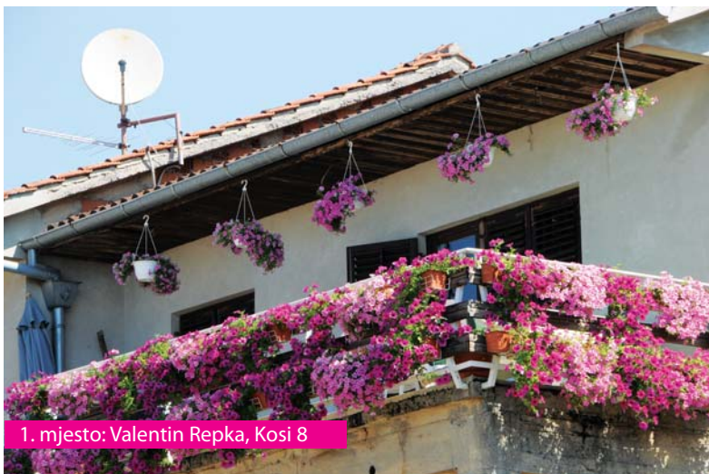
1. mjesto: Valentin Repka, Kosi 8