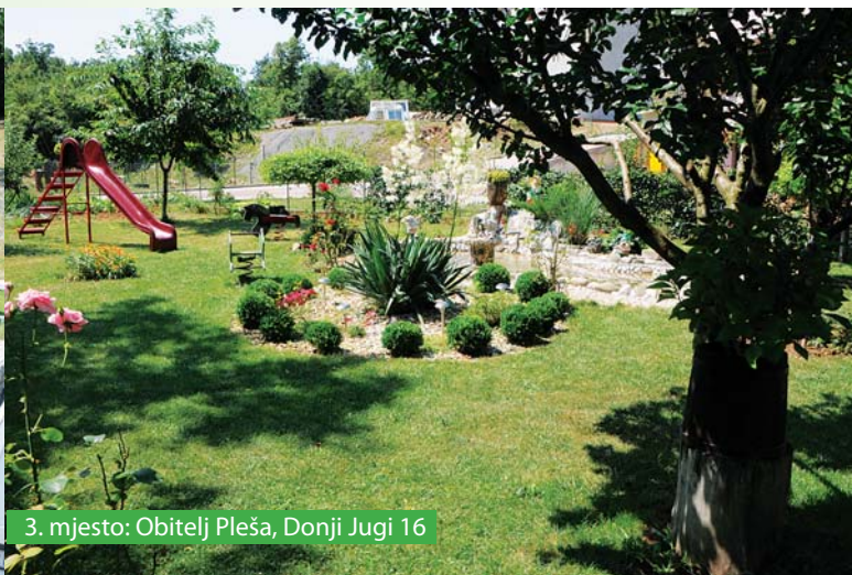
3. mjesto: Obitelj Pleša, Donji Jugi 16