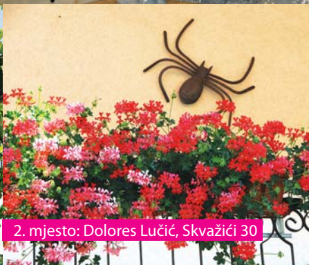
2. mjesto: Dolores Lučić, Skvažići 30