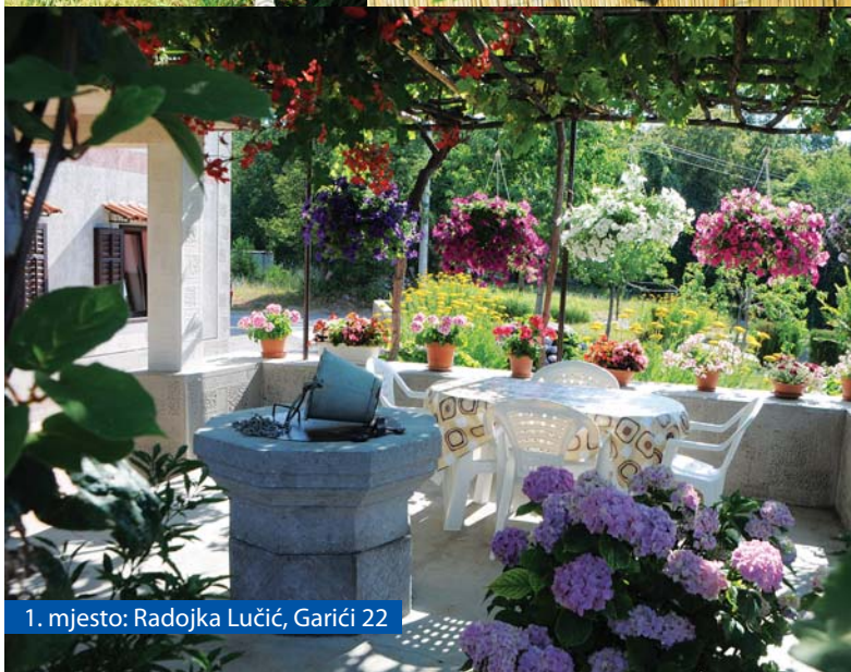
1. mjesto: Radojka Lučić, Garići 22