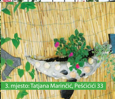
3. mjesto: Tatjana Marinčić, Pešćići 33