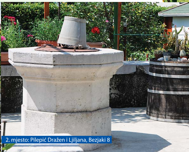
2. mjesto: Pilepić Dražen i Ljiljana, Bezjaki 8