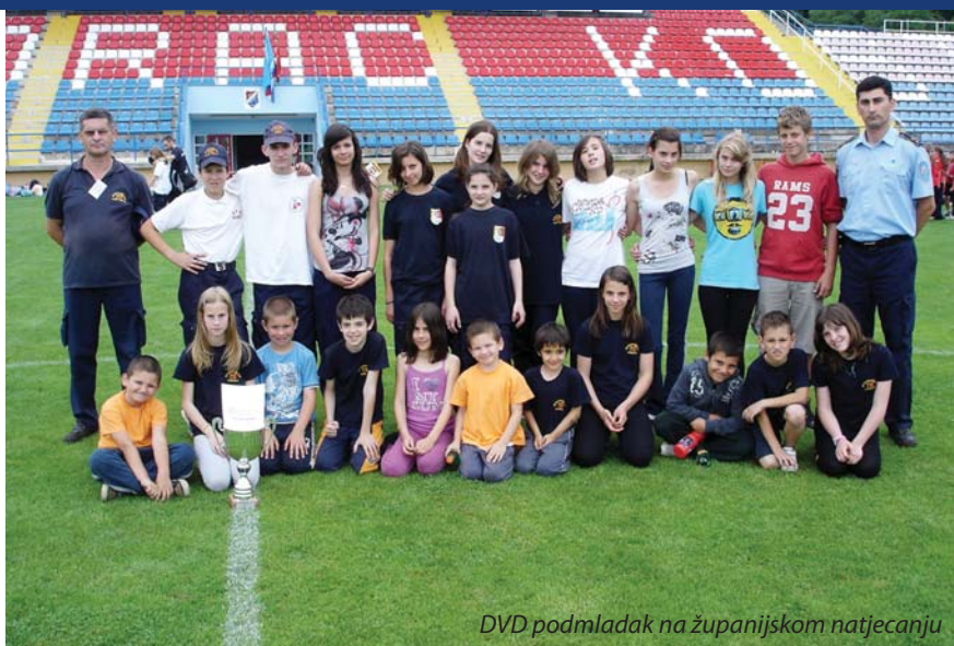
DVD podmladak na županijskom natjecanju