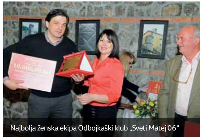
Najbolja ženska ekipa Odbojkaški klub „Sveti Matej 06“