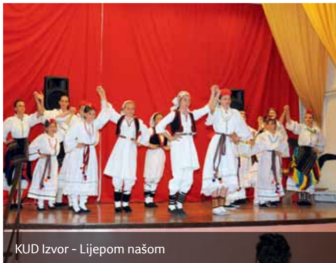
KUD Izvor - Lijepom našom

utakmice pionira i mlađih pionira NK Halubjana i NK Oriješta, ali i "Paričavanje drv po starinski", u organizaciji udruge "Marčej". Završnicu slavlja označila je Svečana manifestacija SKD Prosvjeta, Pododbor Viškovo.