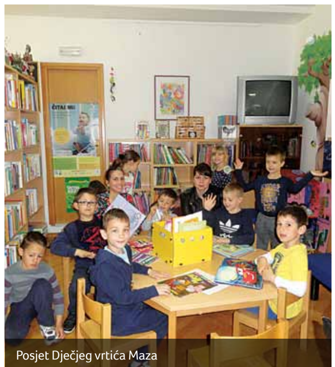
Posjet Dječjeg vrtića Maza