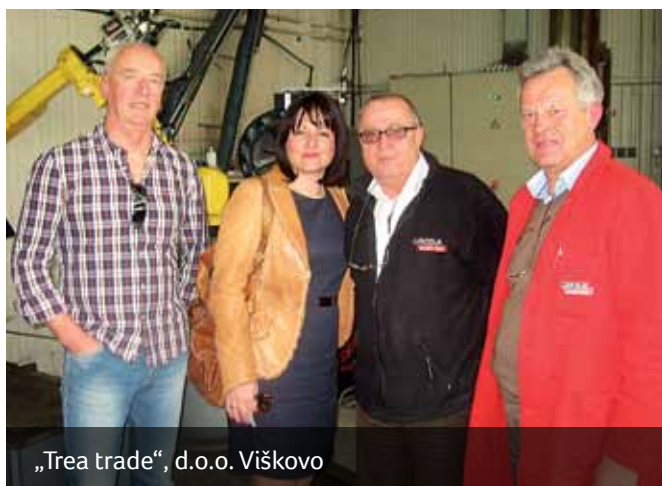
„Trea trade“, d.o.o. Viškovo

S ciljem olakšavanja poslovanja poduzetnicima s područja Op-