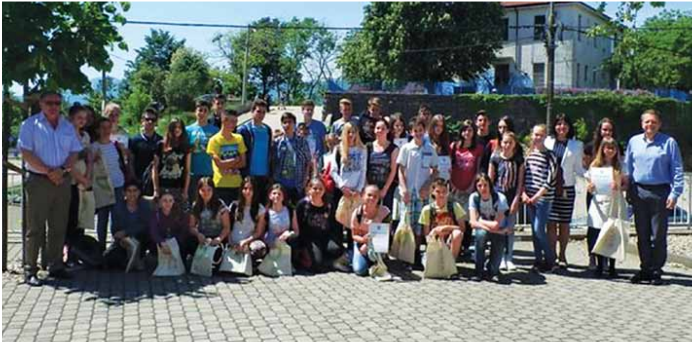
Čak 77 učenika OŠ "Sveti Matej" ostvarili su tijekom šk. god. 2014./15. iznimne rezultate na natjecanjima

Dana 12. svibnja 2015. godine, u Domu hrvatskih branitelja Općina Viškovo organizirala je prijem za učenike Osnovne škole „Sveti Matej“ koji su tijekom školske godine 2014/2015. postigli iznimne rezultate na natjecanjima iz različitih područja: znanosti, sporta, kulture,... Tom prigodom Općinska