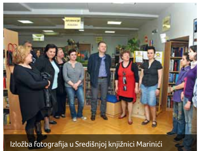
Izložba fotografija u Središnjoj knjižnici Marinići