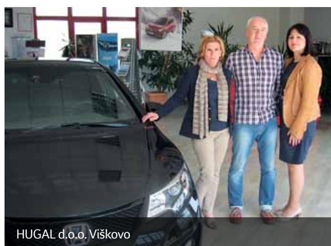
HUGAL d.o.o. Viškovo