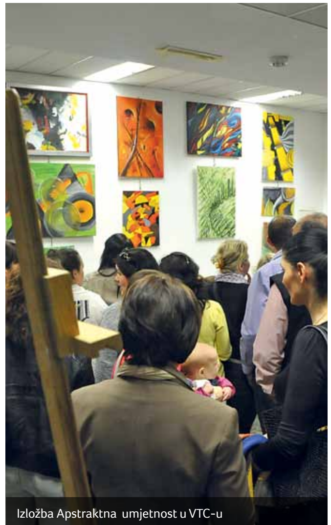
Izložba Apstraktna umjetnost u VTC-u