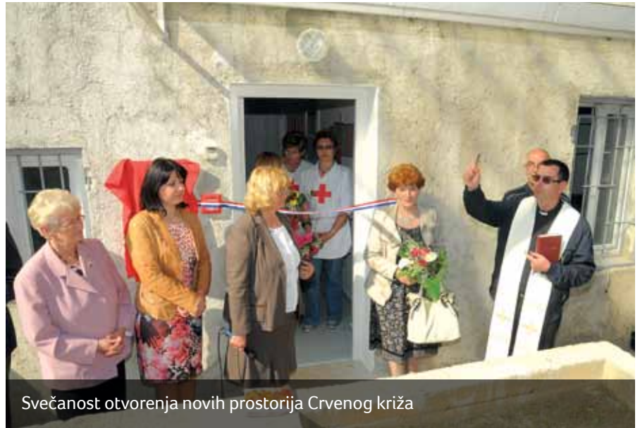
Svečanost otvorenja novih prostorija Crvenog križa

Subota 18. travnja, obilovala je sportskim događanjima: 22. međunarodni boćarski turnir u organizaciji BK „Halubjan“, 9. sportske igre Dječjeg vrtića „Zvončica“, Pikado turnir u organizaciji Pikado kluba „Nevera“, dok se za pred-