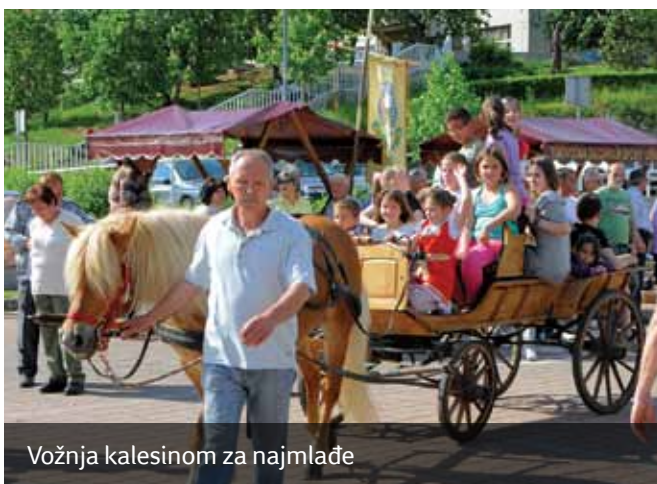
Vožnja kalesinom za najmlađe

povijesne baštine i tradicije našega kraja. Nekada se prvu nedjelju u svibnju održavao posljednji ples prije Bele nedjele, a noć prije plesa mladići su djevojci koja im se svidjela ukrasili kuću majevicom i cijelu noć čuvali kuću kako nitko ne bi majevicu skinuo s krova, prozora, dimnjaka ili stabla. Sramota je bila ako je djevojka umjesto majevice dobila broskvu, što je ujedno označavalo i da se ta djevojka zbog nekog razloga ne sviđa mladićima.