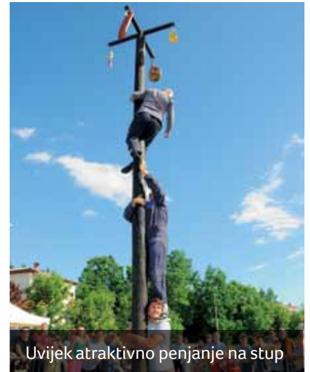
Uvijek atraktivno penjanje na stup