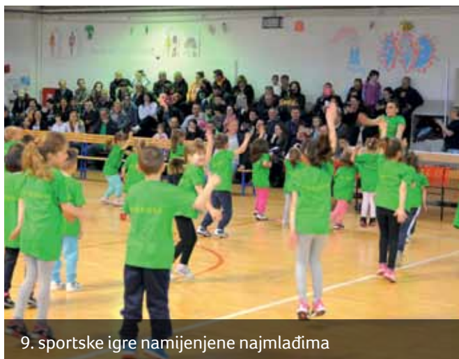
9. sportske igre namijenjene najmlađima