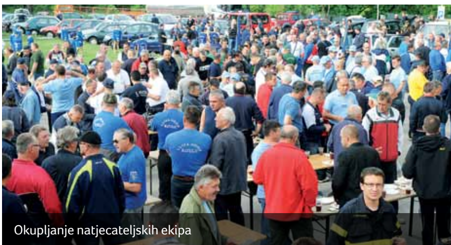
Okupljanje natjecateljskih ekipa

Turistička zajednica pomogla je udruzi UDVDR Rijeka u koordinaciji i organizaciji sportskih natjecanja. Zahvaljujemo svim udrugama, a posebno Limenoj glazbi Marinići, Halubajskim mažoretkinjama, Halubajkama Viškovo, vrijednim članicama Crvenog križa Viškovo koje su natjecateljima dijelile obroke te DVD-u Halubjan na nesebičnom radu, zalaganju i pomoći prilikom organizacije i realizacije sportskih igara, ali i svim gospodarskim subjektima koji su se uključili u ove igre kao i vlasnicima i djelatnicima BP Filtom na ljubaznosti prilikom ustupanja prostora za okupljanje natjecatelja.