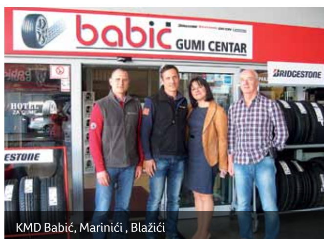
KMD Babić, Marinić, Blažić

Svaka pravna ili fizička osoba koja se registrira na području Općine Viškovo u prvoj godini svog rada ne plaća porez na tvrtku, u drugoj godini plaća 50% iste, a tek u trećoj godini puni iznos