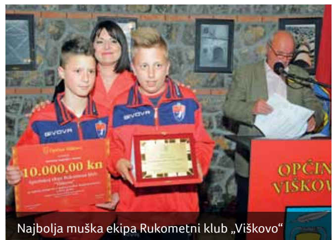
Najbolja muška ekipa Rukometni klub „Viškovo“