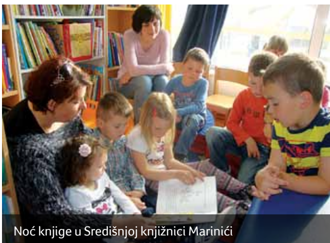
Noć knjige u Središnjoj knjižnici Marinići