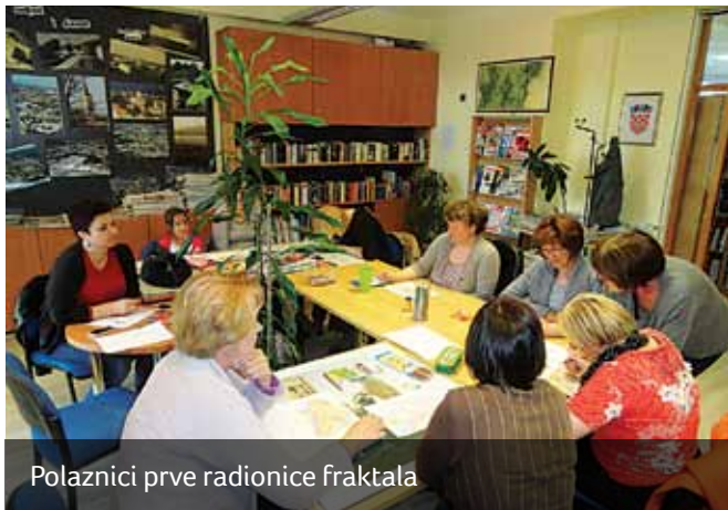
Polaznici prve radionice fraktala

Noć knjige 23. 4. 2015. u knjižnici Marinići protekla je uz tetu pričalicu Natašu koja se podružila s mališanima iz vrtića Zvončica. Smjestili su se na udobnim foteljama dječjeg odjela, a nekolicina mališana i u krilu tete pričalice. Pažljivo i strpljivo slušali su priče o Piku u posjeti baki i djedu, zatim priču o potrebi jedne djevojčice da se druži sa svojim prijateljima, a za kraj svima najljepšu priču o jednom strašnom vuku koji je naučio čitati i zbog toga se sprijateljiio s drugim životinjama. I tete Sindi i Darija iz vrtića Zvončica bile su zadovoljne što su predškolci bili dobri i sa zanimanjem slušali tetu pričalicu.