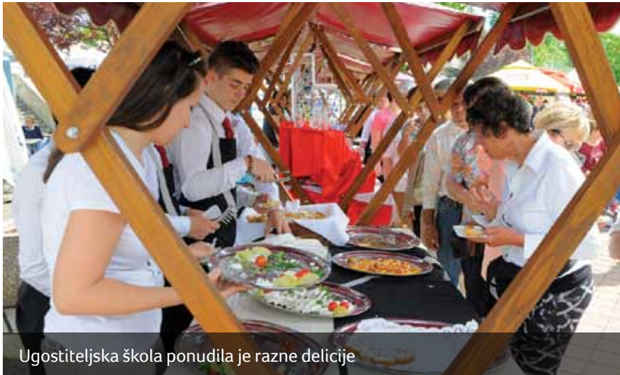
Ugostiteljska škola ponudila je razne delicije