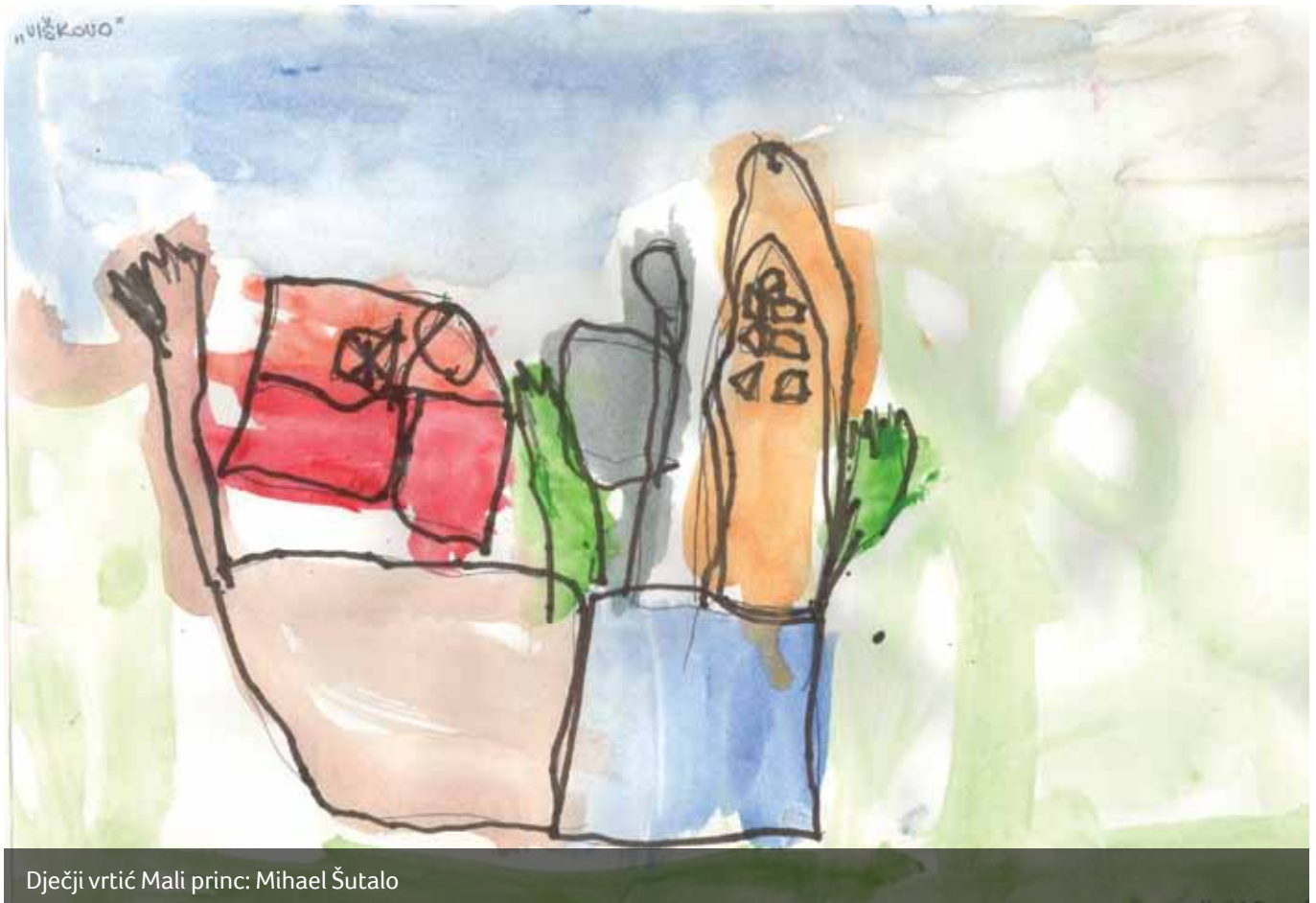
Dječji vrtić Mali princ: Mihael Šutalo

I kao što uvijek biva poslije ratova stanovništvo se moralo suočiti s njegovim posljedicama. Malo koja kuća u Kastavštini nije dala borca, a nerijetko i više, ili surađivala s pokretom otpora. Mnogi su se vratili iz logora ili zbjegova u šume narušena zdravlja, a neki su zauvijek ostali tamo. Mnogo je ostalo udovica i djece bez očeva. Samo iz Halubja bez ostatka Kastavštine poginulo je blizu 400 boraca. Mnogi su sahranjeni diljem Like i Gorskog kotara kojima se ne zna mjesto vječnog počivališta. Sve traume i duševne boli još su se dugo iza rata liječile. Kastavski čovjek oduvijek naviknut na težak rad sada je sa još većim elanom, uz pomoć novih vlasti, prionuo obnovi spaljenih kuća. Kastavština je 25 godina bila odsječena od Rijeke pa je sada gotovo svo radno sposobno stanovništvo našlo zaposlenje u brojnim riječkim poduzećima, a omladina uglavnom nastavlja daljnje školovanje ili izučavanje brojnih zanata. Tako se krenulo s vjerom u bolji život i željom da se ratne strahote nikada više ne ponove.