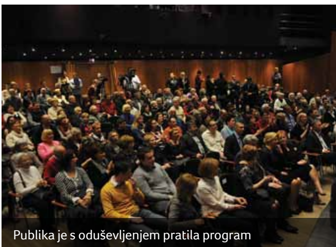
Publika je s oduševljenjem pratila program