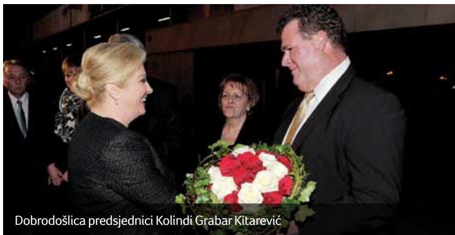
Dobrodošlica predsjednici Kolindi Grabar Kitarović

zorstvom općina Čavle, Jelenje, Viškovo te medijskih pokrovitelja Radio Rijeke, Novog lista, Kanala Ri i Ritv-a.