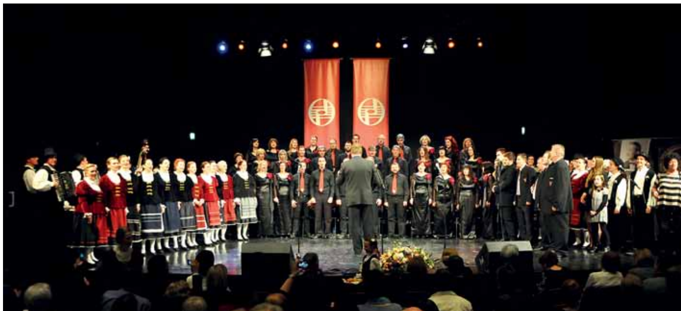
USTANOVA "IVAN MATETIĆ RONJGOV"