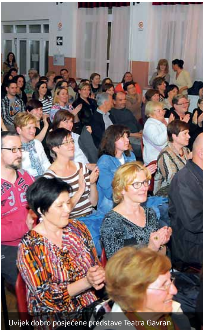
Uvijek dobro posjećene predstave Teatra Gavran

Već tradicionalni turnir, Šahovski klub „Viškovo“ održao je u petak, 17. travnja. U večernjim satima istoga dana održana