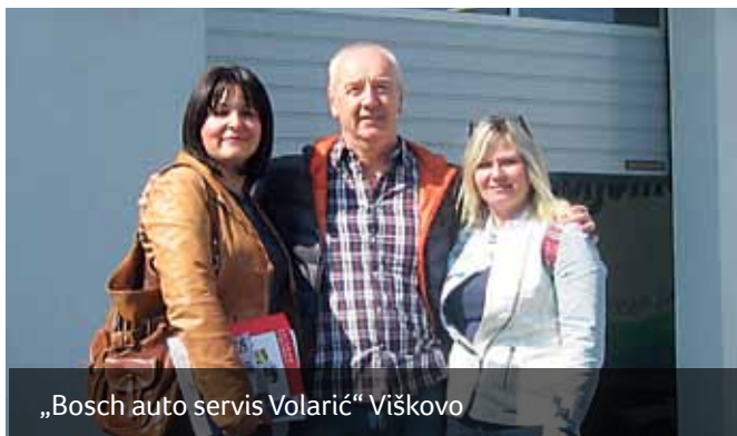
„Bosch auto servis Volarić“ Viškovo

poreza na tvrtku. Također, članak 17. iste Odluke navodi da su poreza na tvrtku oslobođena društva koja zapošljavaju invalide (ako je 40% ili više invalida, rehabilitiranih osoba ili osoba koje su na rehabilitaciji, u odnosu na ukupan broj zaposlenih).