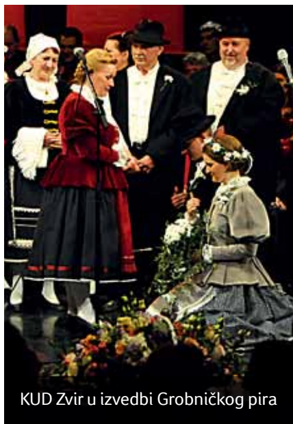
KUD Zvir u izvedbi Grobničkog pira

Čakavska svečanost održana je u surorganizaciji s Katedrom Čakavskog sabora Grobnišćine, a pod pokroviteljstvom Primorsko-goranske županije i spon-