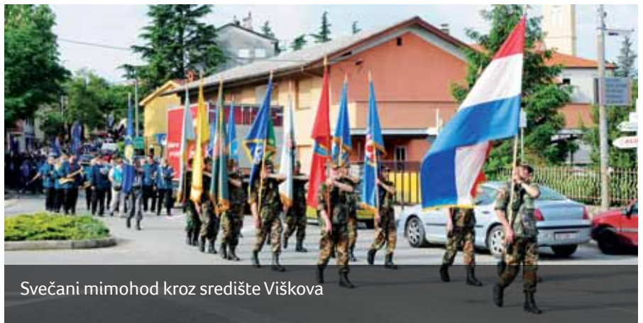
Svečani mimohod kroz središte Viškova

Prvo mjesto u boćanju osvojio je UDVDR Klub Rijeka, drugo rapski dragovoljci, a treći UDVDR iz Općine Vinodolske. U malom nogometu najuspješniji su bili