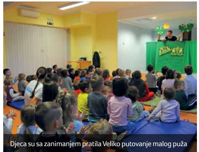
Djeca su sa zanimanjem pratila Veliko putovanje malog puža